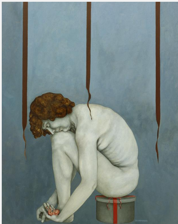
Rimpianto , 1980