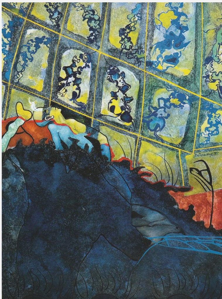
Rivivono le ombre nei luoghi dei ricordi, 2022