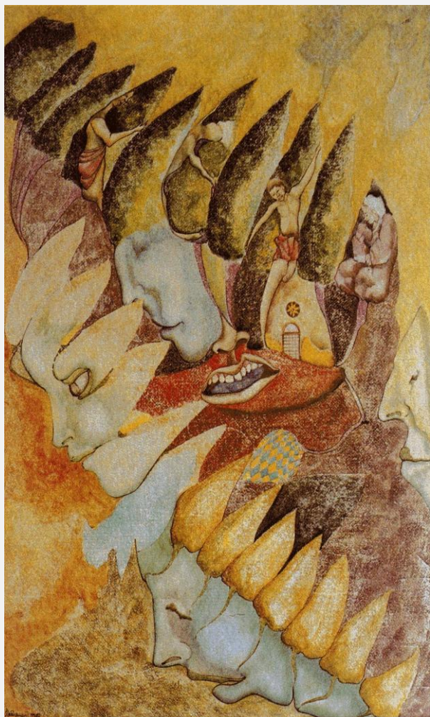
La bocca della verità, 1985